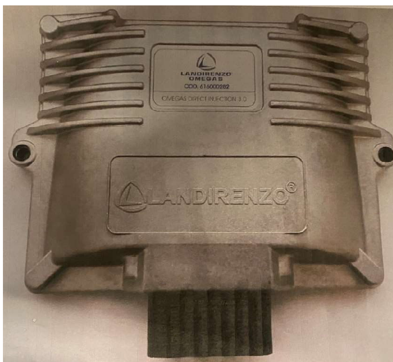
Obr. 1 Riadiaca jednotka OMEGAS plynového zariadenia LANDIRENDO

Metodické usmernenie Technickej služby emisnej kontroly č. 4029/2022 nadobúda účinnosť 01.01.2023.