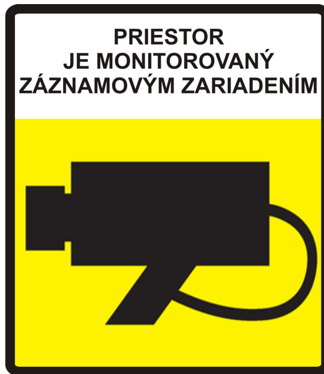
Obr. č. 3: Označenie monitorovaného priestoru STK a PEK

pracovisko prípadne pri výstupe z pracoviska, z oboch strán. Výška označenia musí byť minimálne 300 mm a šírka označenia musí byť minimálne 200 mm. Vzor označenia monitorovacieho priestoru STK a PEK je na obr. č. 3.